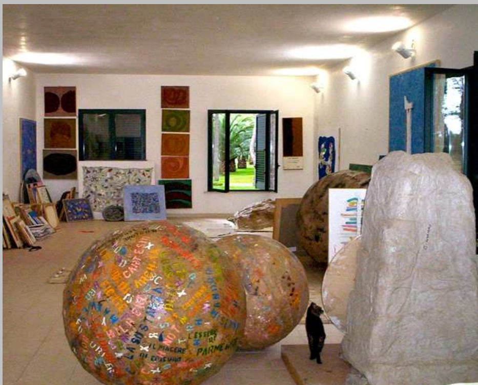
Lo studio di Corrado Lorenzo

http://www.ilcastellodiaglie.it/ita/attivita/eventi/2008/artisti/lorenzo.htm